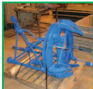
Abrazadera Hidráulica Interna de Alineación