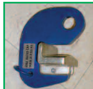
Gancho de elevación