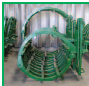
Abrazadera Externa de Alineación